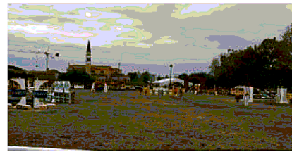
Il campo di gara allestito nel parco di Villa Caffo