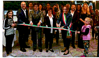
Il taglio del nastro Organizzatori e amministratori all'inaugurazione