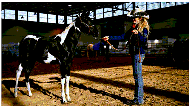
Un viaggio nel mondo delle razze. Arriveranno cavalli da tutto il mondo, più di 2300 esemplari

ciazioni allevatorie di razza - a testimonianza della ricchezza zootecnica della penisola, fondendo elementi tecnico-didattici con le tradizioni e la cultura dei territori a cui ogni razza è legata. Sono 25 le razze presenti a Verona che rappresentano il territorio italiano da Nord a Sud, isole comprese. Dalla Mostra Nazionale del Cai Tpr, ai Concorsi finali dei circuiti territoriali delle diverse razze, fino alle rappresentanze dei corpi militari che tutelano e valorizzano gli esemplari italiani. Senza tralasciare l'aspetto culturale, divulgativo e spettacolare, con le classiche rappresentazioni del "Carosello Italiano", uno dei momenti di maggior attrattiva e fascino dell'intera manifestazione. Anche per l'edizione 2022, Fieracavalli dedica un salone al cavallo da sella italiano nel padiglione 3. Tra le iniziative promosse dal Mipaaf, il ministero delle Politiche agricole, alimentari e forestali che mira al miglioramento qualitativo e quantitativo di questa