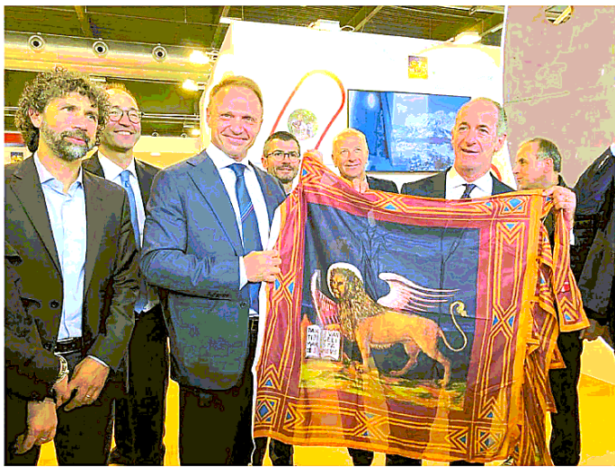
L'inaugurazione della manifestazione di Verona: da destra Zia, Lollobrigida e il sindaco Tommasi

A Verona fino a domenica la 124ª edizione della manifestazione l'eresordio veneto di Lollobrigida da ministro dell'Agricoltura