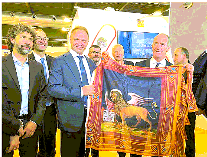
L'inaugurazione della manifestazione di Verona: da destra Zia, Lollobrigida e il sindaco Tommasi

A Verona fino a domenica la 124ª edizione della manifestazione l'eri l'esordio veneto di Lollobrigida da ministro dell'Agricoltura