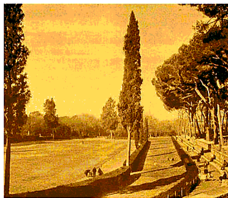
Scatto Un'immagine storica di Piazza di Siena ai primi del Novecento